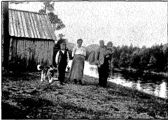
Fra gården Finbakken i Susendalen.

inne på fjellet i noen dager for å fiske, men da fisken svikket, fikk vi se å nå bygden før maten slapp op. Været var ikke bra, det var tåke og det regnet. — Idet vi startet kom en rensdyrflokk springende forbi. Vi fulgte Kjukkelelven østover et stykke, og vi svinget så mere i