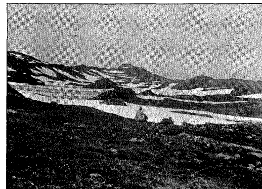
Børgefjell: Ved vannskillet.

bror prøve fiskelykken nede i Kjukkelven, mens jeg skulde legge i ovnen. Ved og never var det nok av utenfor huset, så det skulde jo være svært enkelt, men det var allikevel ikke uten ængstelse jeg gav mig ikast med dette, for for åtte år siden hendte følgende: