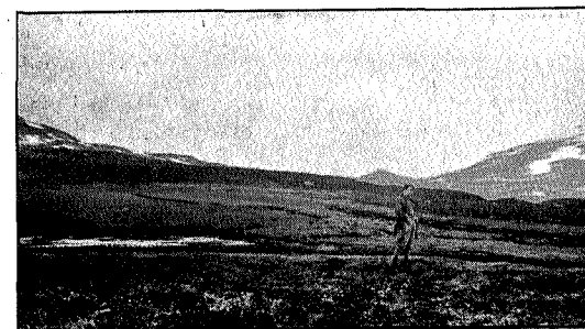
Børgefjell, øst for Jengelvann.