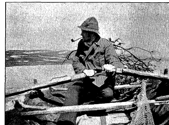
Sne i juli.

nu fanget ind i Orkelsjøens Sænkning ning, og kan ikke komme ud igen. Lyn paa Lyn sprang ud af Skyhvælvet. Stundom var det som Lynstraalen stod i Stene og Fjældet sprudede Ild. Og Regnen stod ned i Straaler. Pludselig var det som Luften blev an-