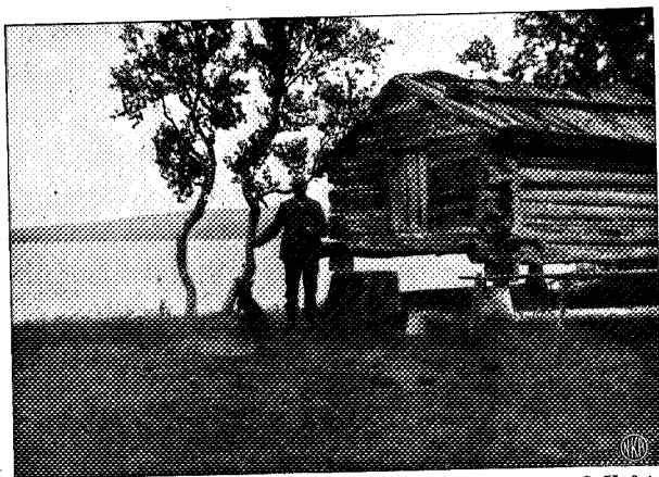
Fra Gommolien ved Skjækerlandet.

Side av Grænsen. I mange Aar har han boet ved Skjæker- vandet og ernæret sig som Jægersmand. Engang var han ogsaa gift, men lunefuld og mistroisk som han var, kunde Konen ikke holde ut med ham deroppe i Ødemarken, og reiste hjem til Imsdalen hvor hun var fra. Efter den Tid flyttet han Pladsen Gommolien ned til Vandet. Før laa den et Stykke ovenfor, som man vil se paa Rektangel- kartet.