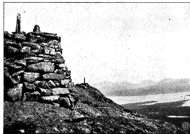
Fra Holdershatten, Grænseros No. 177.