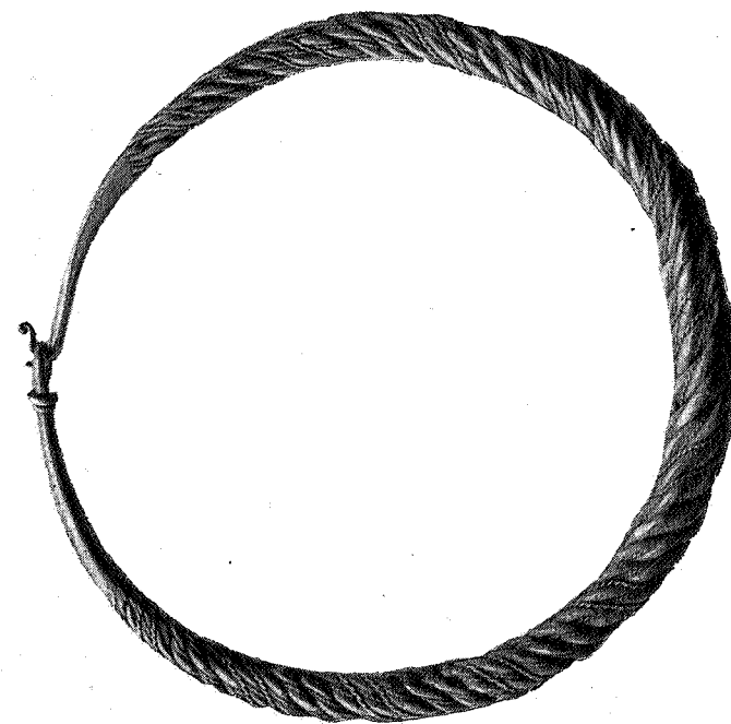
fig. 26. 1/2.

nogle andre fund. Fra Høstad paa Byneset haves et fund af en hel (næsten afslidt) og en halv sølvmynt sammen med to halsringe af sølv, hvoraf den ene her er afbildet som fig. 26, samt et brudstykke