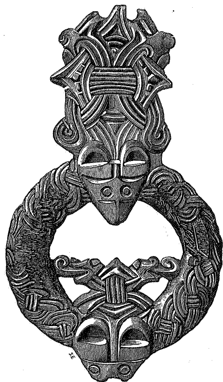
fig. 24. 1/1.

Dog har en enkelt, fra Alstad i Stjørdalen af typen 643, et almindeligt charnier og naaleholder, men festede til skaalens yderste kant, ikke som almindeligt længere inde under den. Den er fundet sammen med en anden spende af typen N. O. 640 med jernbaand og mosaikperler og andre perler af glas og rav m. m. 1) Disse spendeformer maa ganske vist ansees som meget gamle. — Af den ligeledes meget gamle form N. O. 642 kjendes her kun 1 expl., fra Dyva i Stjørdalen 2) . — Af alle typer af skaalformede spender er den enkeltskaalede N. O. 647 den