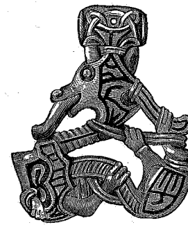
fig. 21. 1/1.

Af skaalvegter haves flere fund foruden de nævnte fra Tønnø, Bjørnes og Vold. Fra Gravraak i Melhus haves rester af en vegtskaal, 2) fundet sammen med det N. O. 511 afbildede sverd med indskrift paa hjaltet, der henviser til frankisk oprindelse, 3) og nogle flere gjenstande af jern. Stykket sees at have været i sterk ild, hvoraf det maa sluttes at have været en brandgrav. — Paa Vigdal i Bu-viken blev for længe siden fundet en balcestang af en skaalvegt; fundforholdene er ikke oplyste. — Fra Rørvik i Nærø har man en enkelt vegtskaal, der opgives at være fundet sammen med underpladen af en dobbelt skaalformet spende, en spydspids og den N. O. 516 afbildede sverddopsko af bronze. Skaalen tyder dog ved sin form snarere paa at tilhøre ældre jernalder, hvorfor der er grund til at tro, at der her foreligger sammenblanding af fund. — Fra Østborg ved Levanger er 3 grav-