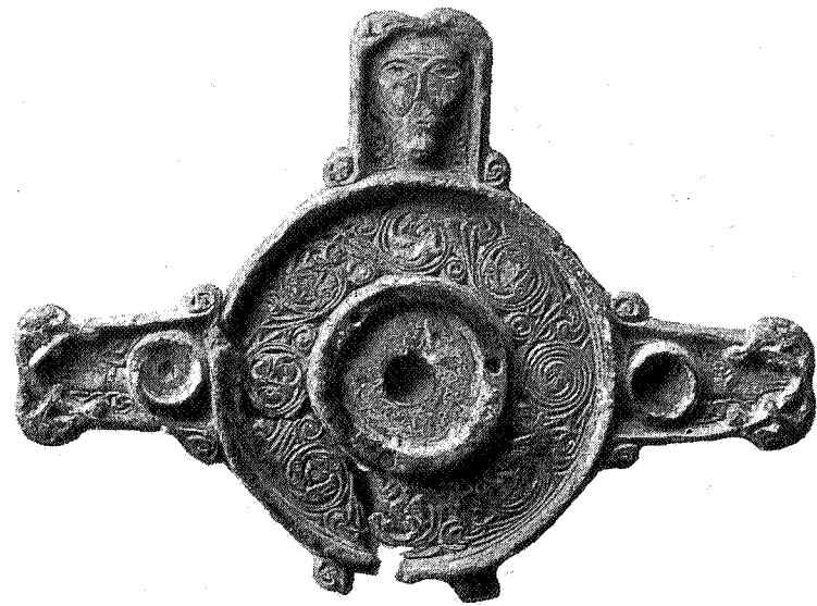
fig. 22. 2 / 3 .

Af stykker, som fremviser ren irsk ornamentstil, har man en række fund foruden de allerede ovenfor omtalte fra Halsan, Smolan og Solstad. Til de smukkeste hører den rigt forsirede ringspænde af forgyldt sølv med indsatte ravstykker, der er afbildet som N. O. 697 og 698. Den er fundet etsteds i Snaasen. — Et pragtstykke er ogsaa det N. O. 628 afbildede beslag af forgyldt bronze, som er fundet med vaaben og redskaber af jern paa Romfohjellen i Sundalen. 2) Paa Gravem i samme bygd skal der være fundet et nu tabt smykke, der antages at have havt lighed med dette. — Og fra Flatvad i Sundalen haves et kopformet beslagstykke af forgyldt bronze, meget ligt det i Aarsb. 1868 fig. 32 afbildede fra Valle i Setersdalen og det i Loranges